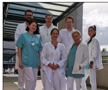
Unser Team in der Schmerztherapie

Parkmöglichkeiten stehen im benachbarten Besucher -und Patientenparkhaus in der Gaffkystraße zur Verfügung (50 Meter Fußweg).